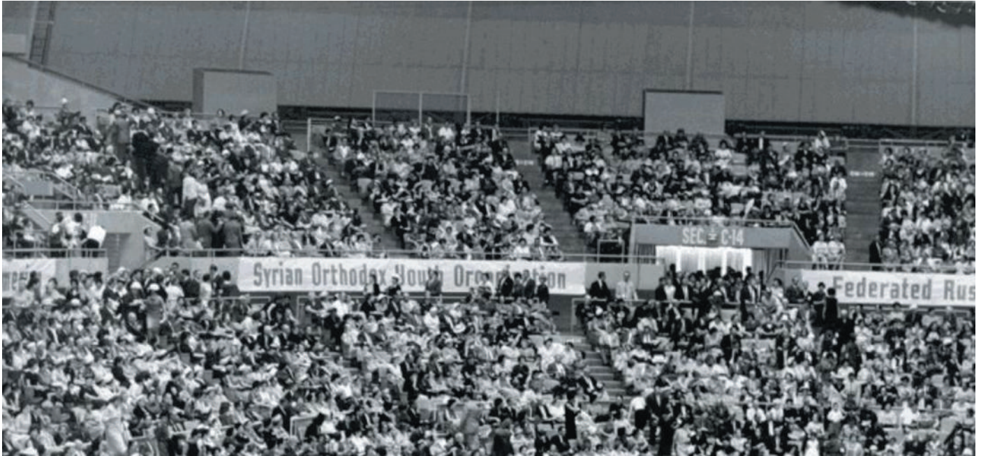
The 1963 rally in Pittsburgh of the Council of Eastern Orthodox Youth Leaders in America

By Seraphim Danckaert Blog: Orthodoxy and Heterodoxy – Doctrine Matters