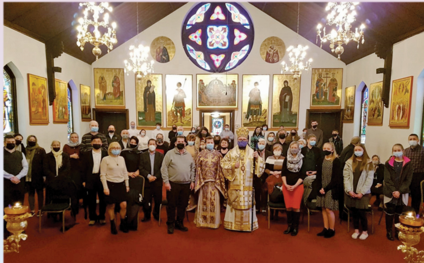
Pastoral visit at the Descent of the Holy Spirit Parish in Elkins Park, PA (March 28, 2021).

Vizită pastorală la Parohia Pogorârea Duhului Sfânt din Elkins Park, PA (28 martie 2021).